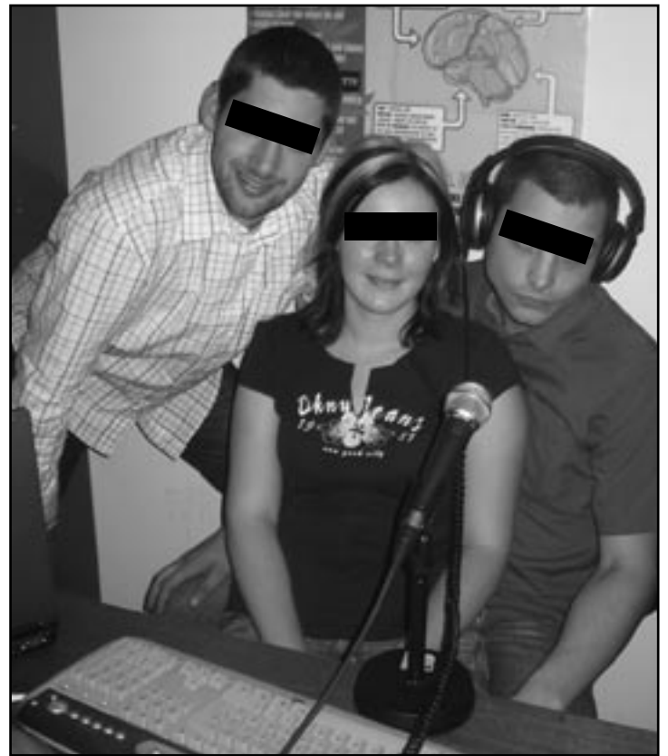
Apollo FM: Die große Unbekannte...