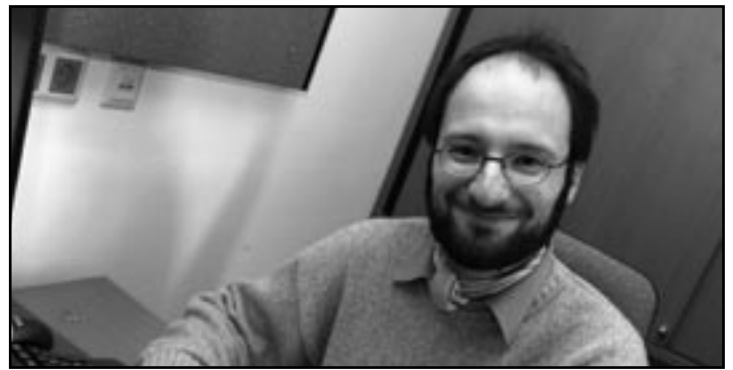
Bei ihm fällt der Abschied schwer.