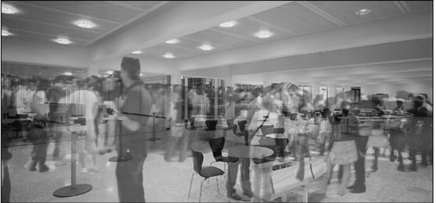
Unipartys könnten bald nur mehr eine blasse Erinnerung an eine Campuskultur sein