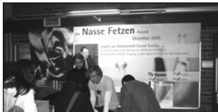
Der Infostand in der Uni im Rahmen des »Nasse Fetzn« Awards

Kontakt: Postfach 5, 9025 Klagenfurt E-Mail: plus@pluspunkt.at Web: www.pluspunkt.at