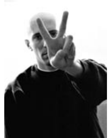
Maynard James Keenan

nen überforderten modernen Messias mit Inbrunst und Bassist Jus-