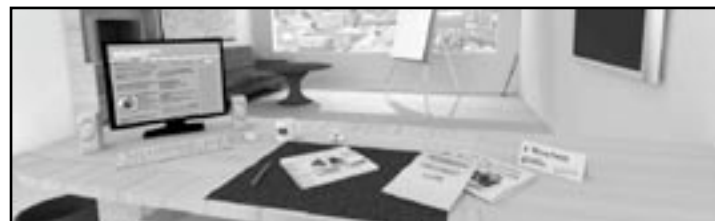
Ein üppiges Polit-Büro darf natürlich nicht fehlen.

Über 20.000 Spielerinnen und Spieler sind auf Bundes-, Landes-, oder Bezirksebene Teil dieses interaktiven, fiktiven Politszenarios. Bevor du in deinem virtuellen Büro frisch und motiviert zur Tat schreiten kannst, musst du dich entscheiden ob du einer der vielen Parteien beitreitest oder eine eigene gründest. Anfangen muss jeder Neueinsteiger als einfaches Parteimitglied, um Tag für Tag auf der Erfolgsleiter dieser virtuellen politischen Welt eine Sprosse nach oben zu klettern, bis er oder sie im Idealfall Bundeskanzlerin wird.