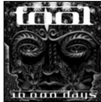
Erstes Lebenszeichen nach fünf Jahren

sprache mit den Progressive Rock-Überlebenden von King Crimson seine Effektpalette merklich aufgestockt, Drum-Professor Danny Carey trifft den Takt mathematisch exakt, Sänger Maynard präsentiert die lyrische Geschichte rund um ei-