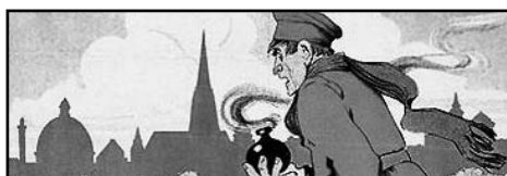
Bruder Reinholds Giftküche