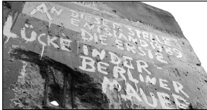
Die Berliner Mauer. Keiner glaubte an den Fall und es ist doch passiert.

Waren es im Wintersemester 2005 noch drei Klausuren, die für ein mögliches Ranking und damit für