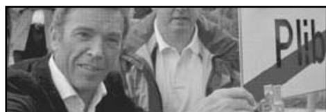
Nein, danke. Ich bleib hier!