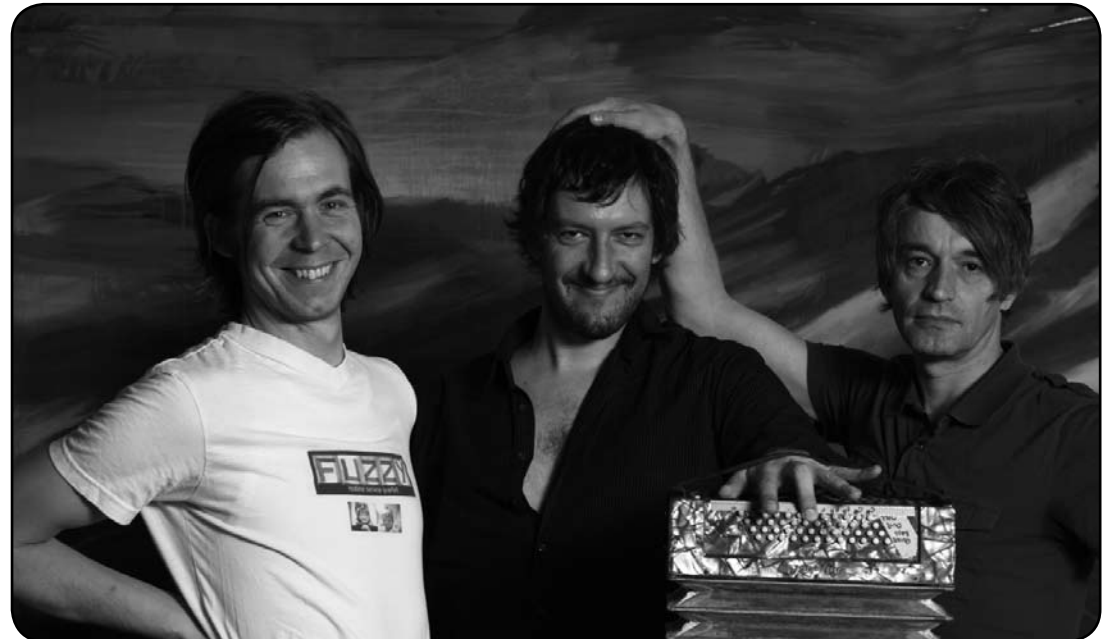
Die Klagenfurter Naked Lunch warten mit Neuem auf: »This Atom Heart Of Ours«