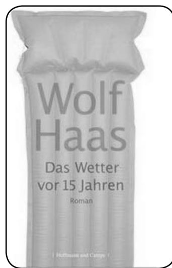
»Das Wetter vor 15 Jahren« um 19,50 Euro bei KBuch.

Damit du dir deine eigene Meinung über das Buch bilden kannst, verlosen wir es (zu Verfügung gestellt von kbuch). Beantworte folgende Frage und schreib die Antwort an gewinnspiel@pluspunkt.at .