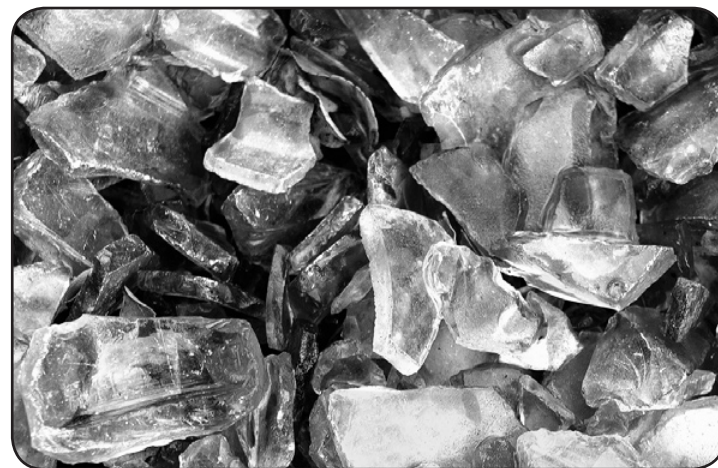
Tausend kleine Teilchen - »A million little pieces«

Nichtsdestotrotz hat die Leserin oder der Leser (zumindest ging es mir so) das Gefühl, neben ihm herzuziehen. Man begleitet ihn auf der Fahrt in die Klinik; spürt die Schmetterlinge im Bauch wenn er Lilly – die zarte Frau mit den wasserblauen Augen – sieht; spürt das Unbehagen, wenn er seine Eltern zur Familiensitzung trifft; leidet mit ihm, wenn er sich vor Schmerzen windet. Entscheidend für dieses »Mitleben« und Eintauchen in seine Welt, ist vor allem Freys Schreibtechnik. Seine Sätze beste-