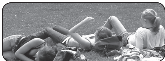
Die Stille genießen... Ein ruhiges Uni-Viertel kann auch ein Vorteil sein!

Die Lebensqualität im Uni-Viertel ist trotz allem fast nicht zu übertreffen. Die Nähe zur Uni ist besonders an vernebelten Herbstmorgen praktisch, wenn man das öde Grau selbst zu Fuß nur ein paar Minuten lang ertragen muss. Außerdem gibt es einige wichtige Einrichtungen: das BIB (Büro für internationale Beziehungen), das neue USI-Gebäude (Universitätssportinstitut), die Post, ein Kopiergeschäft und Banken. Weitere Infrastruktur findet sich in der Universitätsstraße: Apotheke, Geschäfte und Lokale. Unschlagbar jedoch ist die Nähe zum Europapark, zum See und zu den Sportplätzen; im Sommer locken das vielgeliebte Strandbad bzw. die Wildbadeplätze. Verkehrsberuhigte Straßen und der Radweg neben dem Lendkanal sind ideal, um mit dem Rad in die Stadt zu fahren.