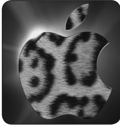
Apfel im Leopardenfell: Mac OS X Leopard

Der lang ersehnte Nachfolger von »Tiger« soll durch rund 300 kleinere und größere Verbesserungen noch anwen-