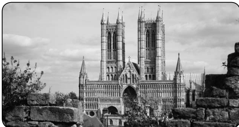
Die Kathedrale von Lincoln, Großbritannien.

Not everything is bad about studying in England though. We already saw a lot of the country and have been very fortunate with the weather so far! England has lots to offer, especially when the sun is shining! Lincoln itself turned out to be small, but really beautiful! When you're in the cathedral quarter it feels like you're taken back to a different time and place. It is a strange feeling to be away from home and all of a sudden I feel so grown up. Not seeing people you usually see everyday, not being able to speak to your family whenever you want is hard. It just feels strange not to be at home. Suddenly you realize that there are things you miss and you learn to appreciate what you've got back home!