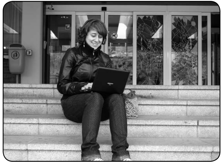
Passen in jede Handtasche und schauen schick aus: Netbooks.

zu klein ist und die Auflösung viele Anwendungen nicht richtig darstellen kann. Bei 8,9 Zoll Modellen stimmt die Letztere, jedoch werden sich manche Augen noch etwas schwer tun. Erst bei 10,2 Zoll hat man genug Platz zum Surfen und Arbeiten, für Film und Musik. Auch Speicherplatz sollte genug vorhanden sein: 1GB RAM und etwa 80 GB Festplatte. Bis Redaktionsschluss gab es nur drei dieser Modelle im Handel: Die zwei fast baugleichen Modelle, der »akoya mini« von Medion (bereits seit Juli bei Discounter »Hofer«), der »Wind« von MSI, sowie der kürzlich auch in Europa erhältliche »Eee-PC 1000H« von Asus. Kaffee sei Dank sind auch andere Hersteller aufgewacht und bereits in ein paar Tagen kommen einige Neue und sehr interessante Produkte auf uns zu. »A1 hat seit kurzem ein interessantes An-