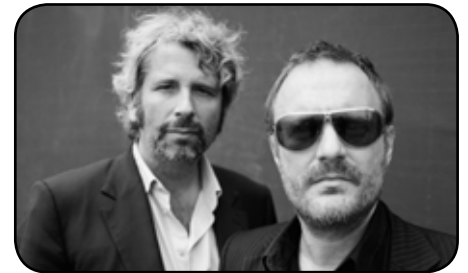
Die umstrittenen Künstler Stermann und Grissemann

Im Dezember hätten Grissemann und Stermann mit ihrem Kabarettprogramm „Die deutsche Kochschau“ an der Uni Klagenfurt auftreten sollen. Genau: sollen. Leider wurde der Auftritt jetzt abgesagt. Die Gründe sind den meisten von uns wohl bekannt: Massive Interventionen des Landes Kärnten, die Stermann und Grissemann aufgrund ihrer „pietätlosen“ Darstellung der Berichterstattung zum Tod Jörg Haiders, nicht in Kärnten haben wollen. Anschlagsdrohungen für die Veranstalt-