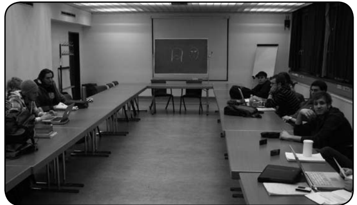
UV-Sitzung ohne Vorsitz-Team. Arbeitsverweigerung?

keine nützlichen Informationen für Studierende enthalten. Andere (unabhängige) Referate, die laufend Projekte organisieren oder täglich Studierende beraten sind nicht Teil der Kampagne, geraten hier in den Hintergrund und bleiben unsichtbar. Nicht zuletzt deshalb haben sich diese in der Sitzung über die unnötigen Kosten dieser Kampagne beschwert. Die ÖH-Beiträge könnten sinnvoller genutzt werden. Allerdings sind die rot-schwarzen-Nachwuchspolitikerinnen und -politiker auf