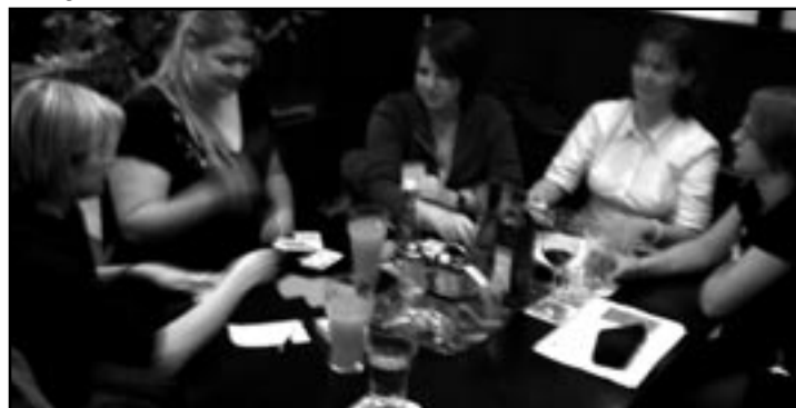
Der Frauenstammtisch im Panta Rhei.

aufbauen und uns gegenseitig unterstützen, wird es uns auch später am Arbeitsmarkt möglich sein, bei gleicher Qualifikation der Bewerber, Frauen einen Arbeitsplatz zu ermöglichen um so die Arbeitslosenrate zwischen Frauen und Männern auszugleichen. Frauen dieser Uni, vernetzt euch!