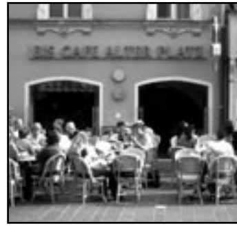
Eis-Café Alter Platz

Geschichte, suchen wir die Diele mit dem deutschen Namen heim. Dort ist die Bedienung allerdings größtenteils italienisch, also bestellen wir klassisch »cioccolato e vaniglia«, und lassen die anderen 25 Sorten, sogar »Baunty« [sic!]