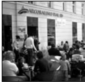
Arcobaleno: Wienergasse 11

baleno bestellt. Aber das kommt uns sowieso nicht in die Tüte, also: »Einmal Rhabarber und Feige, bitte!«. Die Eis lady schaut zwar etwas verdutzt, türmt aber dennoch zwei mächtige Kugeln zu einem cremigen Eisberg auf die Tüte. Letztere